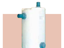
雨水受けタンク 100L・200L (白・黒)