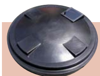
AT-2000H 用フタ (アクリル窓付)