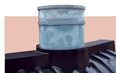
AT-1500 用アジャスター (H300 + H150 の組み合わせ例)