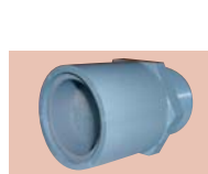
50A オール(ーフロー部 (アミ付)